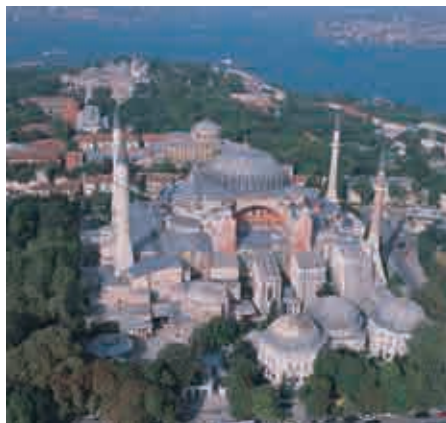
▶ イスタンブルが辿ってきた歴史を象徴するアヤ・ソフィア。2020年に再びモスクとなった。

御校は 言語学習の比重が他大学に比べて大きく、留学が必須とされています。 1年次から集中的に言語を学び、 それを使って国や地域の現実に即した研究をすることで、より深く自分の興味関心を掘り下げていけると考えています。