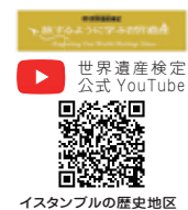
イスタンブルの歴史地区

◀ アヤ・ソフィア内部。イスラム教の預言者ムハンマドの名を書いたアラビア語のカリグラフィ（写真中央左）と、キリスト教のモザイク画（写真中央上部）が同じ空間に残っている。2020年にモスクとなってからは、イスラム教の礼拝時にモザイク画に布で覆いがかけられることとなった。礼拝時間以外は観光客も見学が可能。